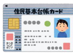
住民基本台帳カード