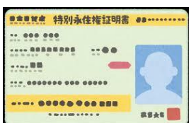
特別永住権証明書